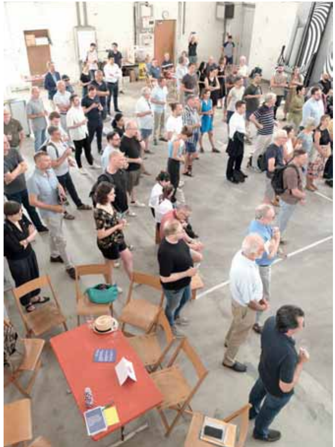
Kickoff-Anlass am 21. Juni im Gaswerkareal