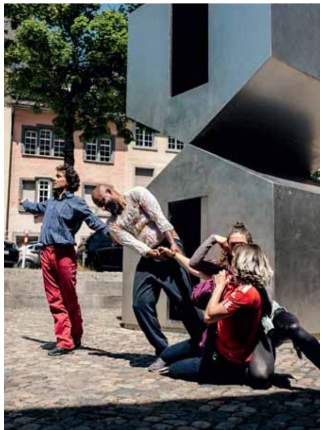
ESKAPADEN – Getanzte Zwischenmenschlichkeit von bollwerk in der Münsterabsenkung