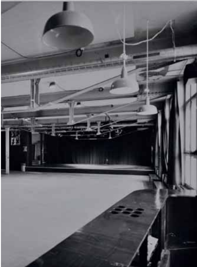
Ein Bild aus der Kammgarn aus dem Jahr 1992

tung wird geteilt, Entscheidungen entstehen im Gespräch, nicht im Organigramm. Die Stärke dieser Arbeitsweise ist ihre Flexibilität; die Schwäche ist ihre Anfälligkeit, sobald einzelne Personen ausfallen.