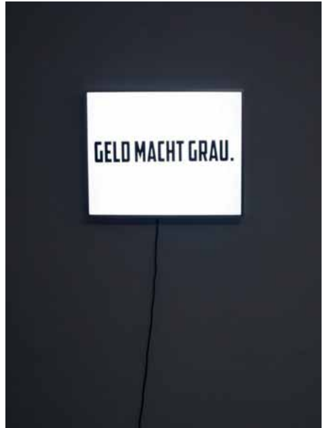
«Leuchtkasten #1, (Geld macht grau)» von Jan Thoma entstanden während dem Atelier Stipendium in Berlin

wieder sichtbarer und zugänglicher zu machen und sie in einen gesellschaftlichen Dialog zu bringen. Der moderne Mensch ist zudem konstanten Reizen ausgesetzt und hat somit viel weniger Aufnahmefähigkeit für Kunst. Ich versuche dem entgegenzuwirken und Momente zu schaffen, die entschleunigen. Vor allem bei jungen Menschen haben sich die Interessen stark verändert, und ich versuche, Konzepte zu entwickeln, die auf diesen Wandel zugeschnitten sind.