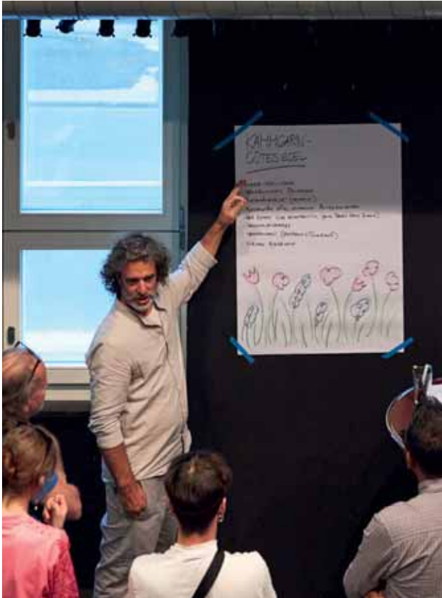
Der Workshop Verankerung im Team vom 25. August