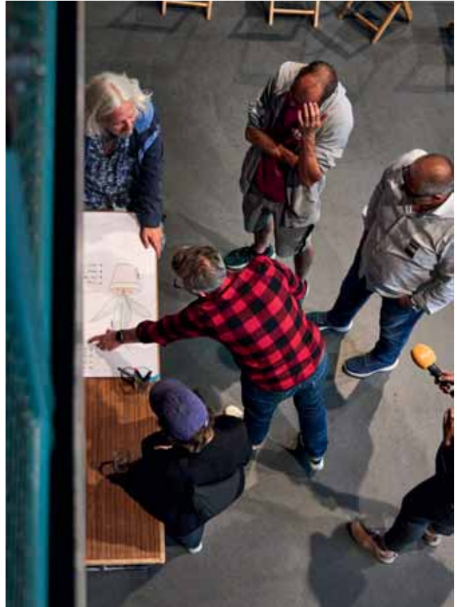
Der öffentliche Zukunftsworkshop vom 8. Juli

mitgenommen habe, ist die Erkenntnis, dass ein Weg, als Arbeitgeberin attraktiver zu werden, darin besteht, die Auslastung der Aktionshalle zu erhöhen. Ich kann von meinem 85%-Pensum leben. Zwar nicht auf grossem Fuss, aber ich kann davon leben, und KiK ist mein Arbeitsmittelpunkt. (Das ist wohl auch der Grund, weshalb ich bald zehn Jahre Teil des Teams bin.) Mitarbeitende, deren Aufgabebereich sich auf die Arbeit an Veranstaltungen beschränkt, können das nicht von sich behaupten. Mit ihrem 20%-Pensum haben sie in den meisten Fällen noch andere Jobs und wenn dann die Möglichkeit besteht, im anderen, meist besser bezahlten Job aufzustocken, ist die Versuchung natürlich gross. KiK wird dann schnell nebensächlich. Natürlich zeigt mir der Prozess auch auf, wo bei meiner eigenen Arbeit noch Luft nach oben ist. Ich stelle nämlich