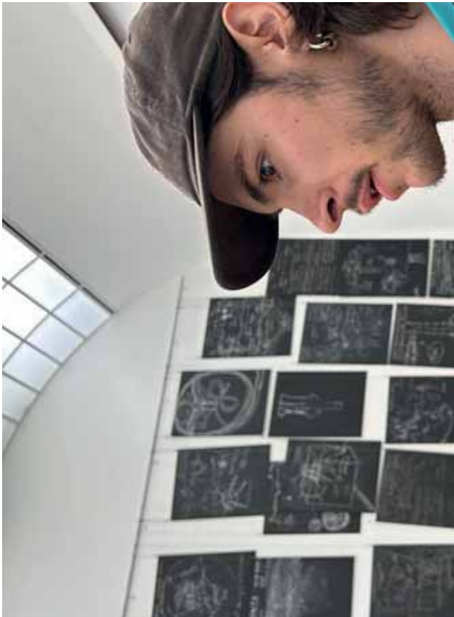
Vor dem Kunstwerk «Das Kapital Raum 1970-1977» von Joseph Beuys im Hamburger Bahnhof, Berlin, 2025