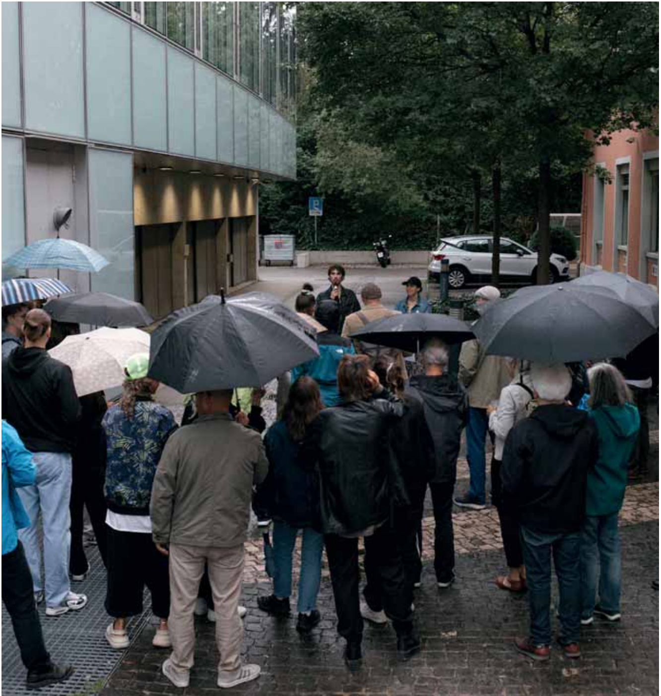
Treffpunkt für den Rundgang an der Vernissage der Ausstellung «der geöffnete Raum»